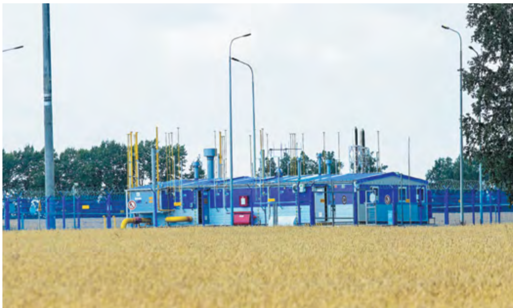
Все объекты Алтайского ЛПУМГ оформлены в соответствии с фирменным стилем ПАО «Газпром»