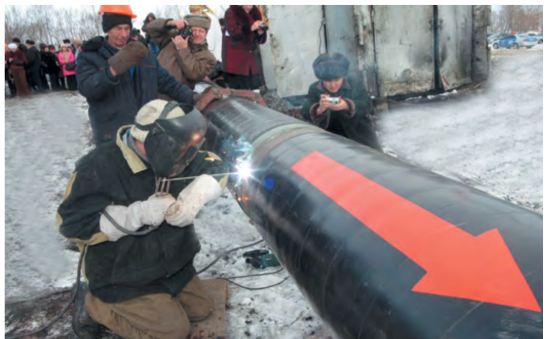
Первый стык МГ Бийск – Горно-Алтайск