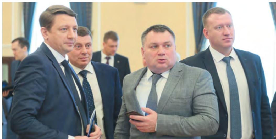
Важная роль в реализации стратегии управления человеческим капиталом отводится руководителям компании