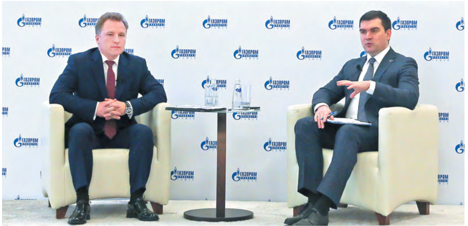
Интервью-студия с генеральным директором компании

– Мы вплотную подходим к ключевой теме нашей дискуссии – стратегии развития ООО «Газпром трансгаз Томск». По словам аналитиков, обычно в разработке и реализации подобного документа участвует только часть коллектива. Нужно ли обратить на это внимание? Поступают ли от сотрудников инициативы по развитию или система работает только сверху вниз?