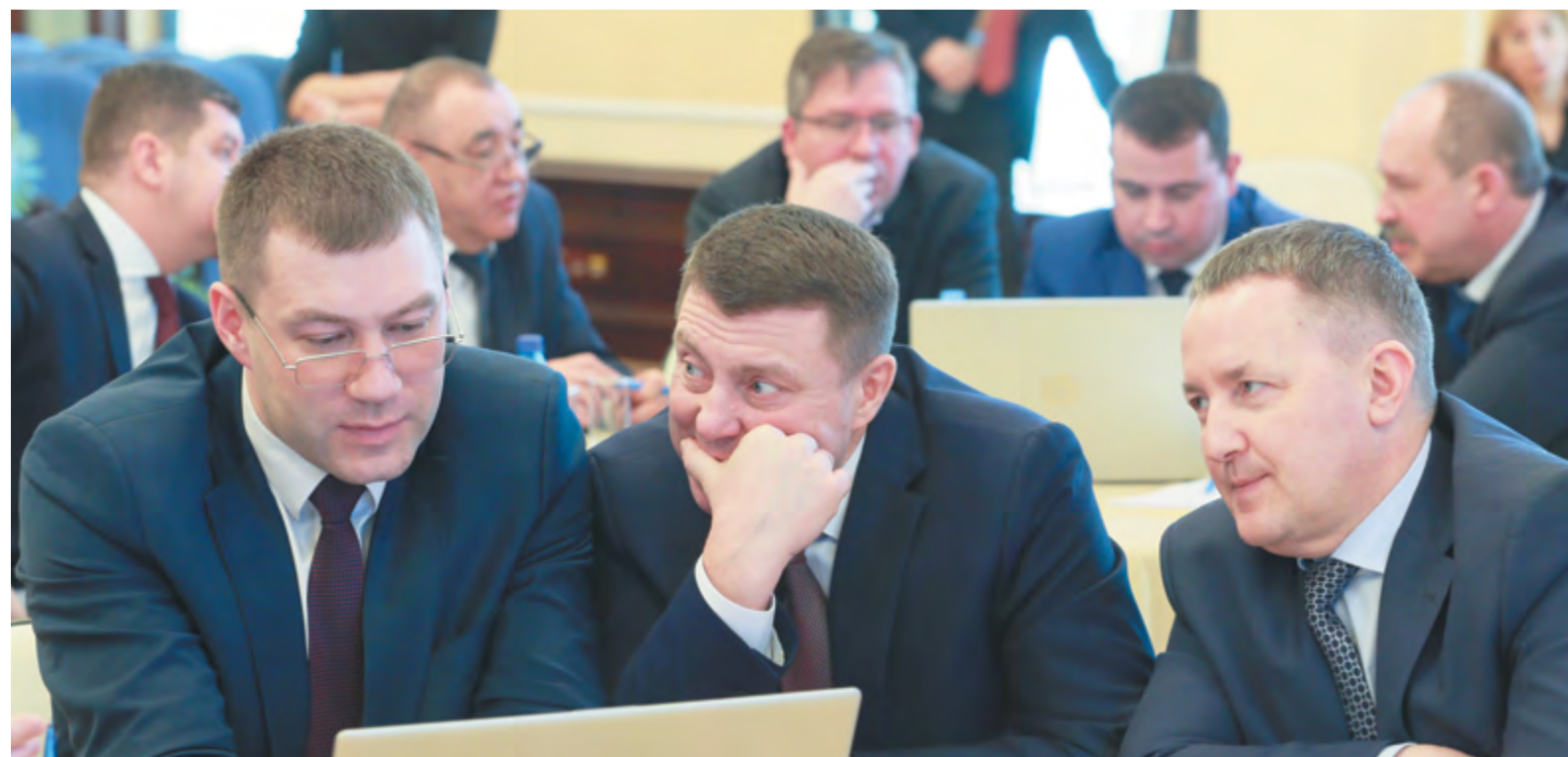
Живая дискуссия – один из главных принципов нового формата проведения мероприятий

В период строительства магистрального газопровода «Сила Сибири» компания провела колоссальную работу по налаживанию взаимодействия с местными органами власти, обучению нового персонала. Политика привлечения работников из числа жителей Республики Саха (Якутия) будет продолжена.