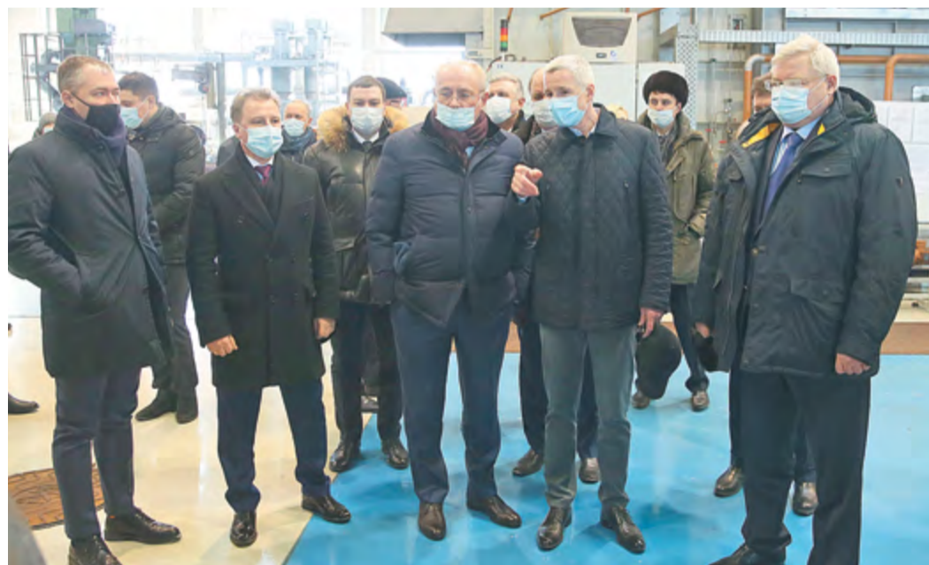
Делегация ПАО «Газпром» посетила выставку продукции томских предприятий, которая прошла на территории АО «ТЭМЗ»

– Газпром является стратегическим партнером Томской области, – отметил губернатор. – Наши заводы в течение многих лет осуществляют поставки своей продукции на объекты компании. При этом Томская область ста-