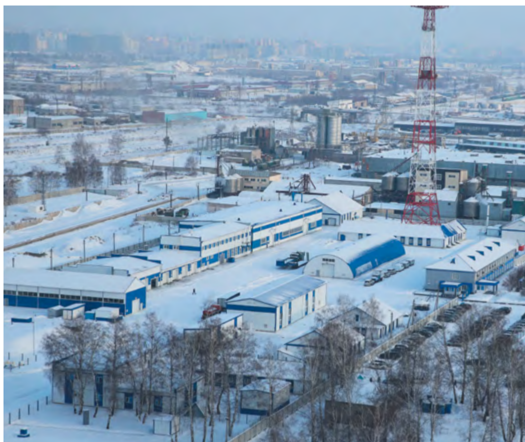
База Алтайского ЛПУМГ