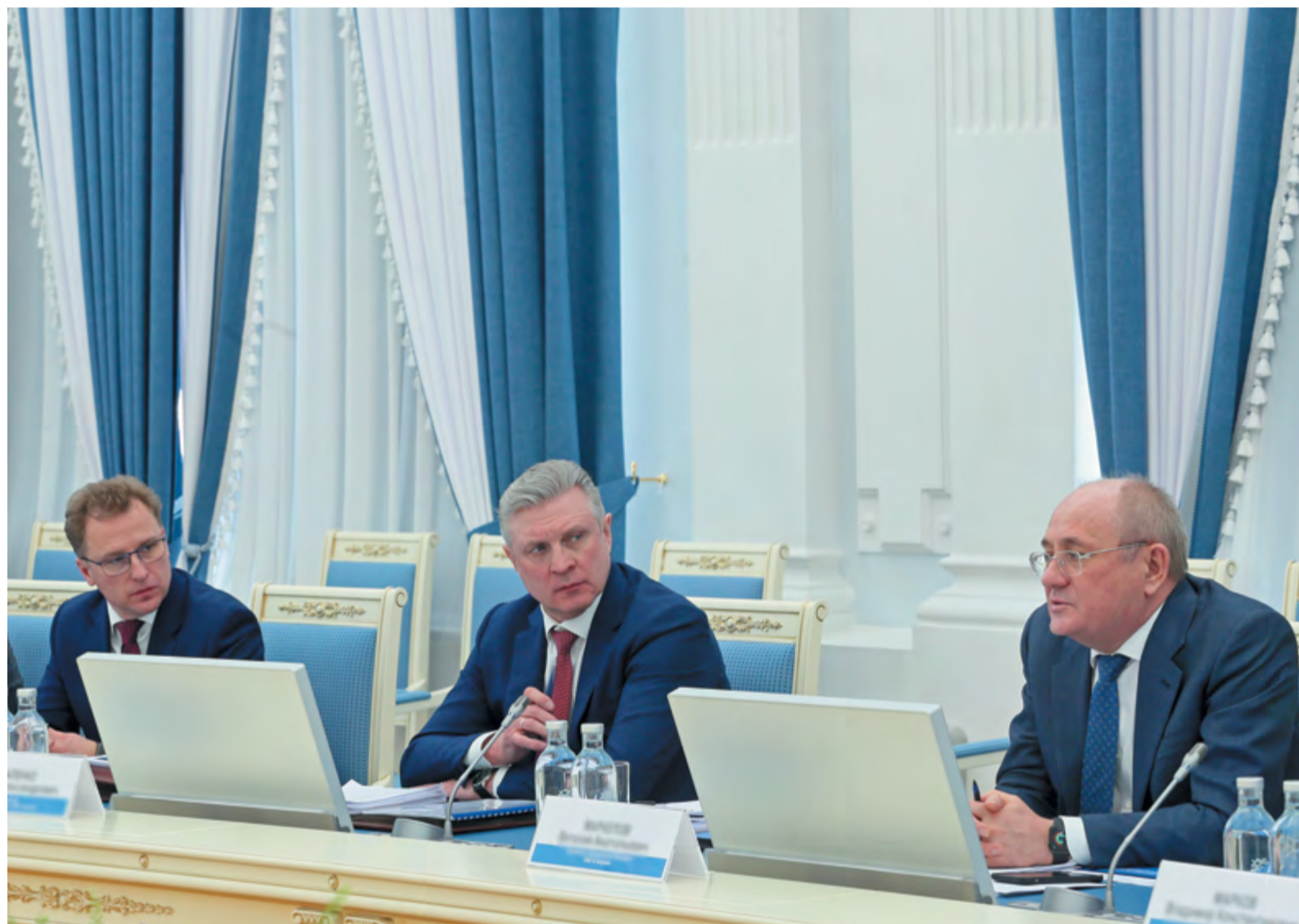
В ООО «Газпром трансгаз Томск» прошло совещание по вопросам сотрудничества ПАО «Газпром» и томских промышленных предприятий